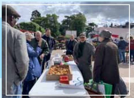
Café-croissant rencontre avec les administrés