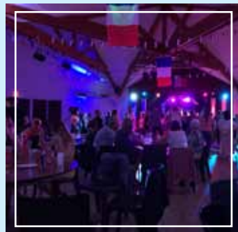
Bal des pompiers