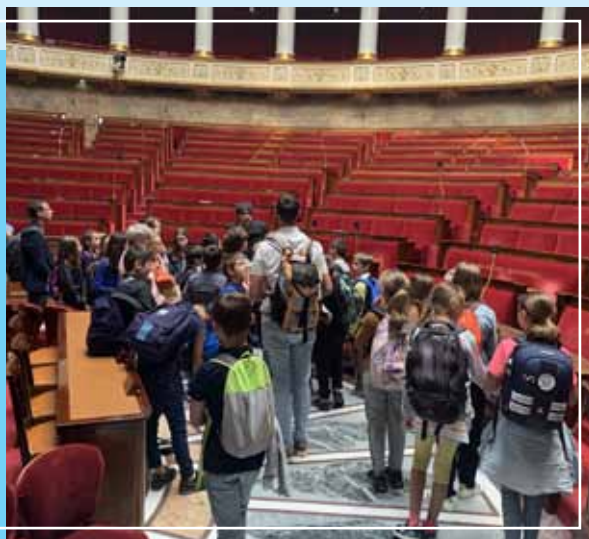
Visite des élèves de CM2 à l'Assemblée Nationale