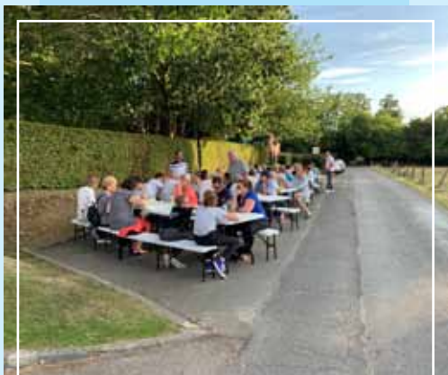
Cinéma plein air à Thuit-Hébert