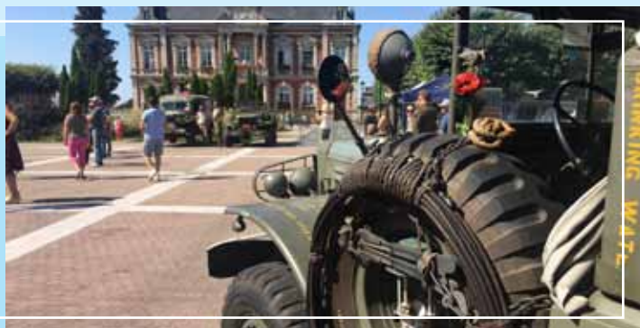
75 ème anniversaire de la Libération - concert jazz et exposition d'engins militaires