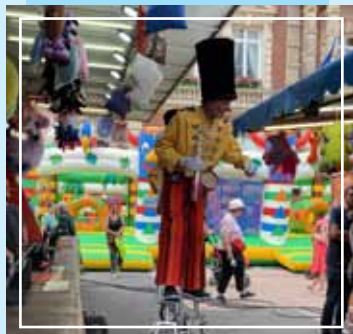
Les Grooms Cyclics lors de la fête patronale